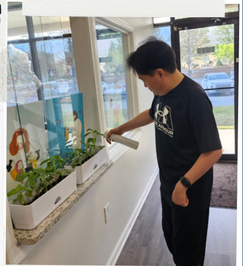
잘 자라길.. 식물에게도 세심한 사랑이 필요합니다