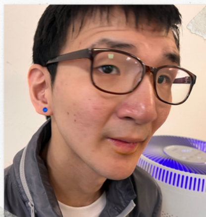
학창시절 왠지 껌 좀 씹은 듯한..