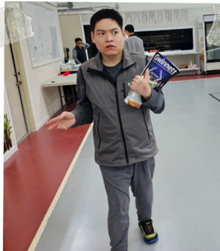
바쁜 도시의 혼한 전문직