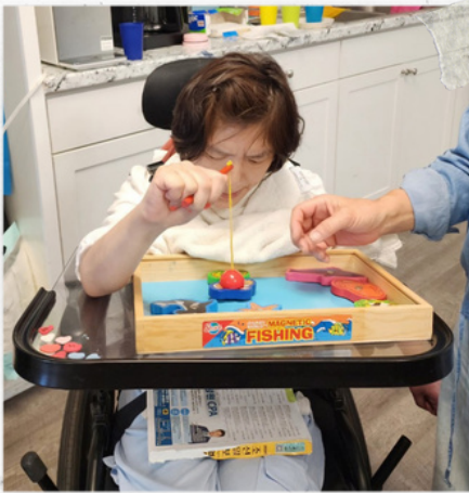
뒤늦게 깨달은 낚시의 재미