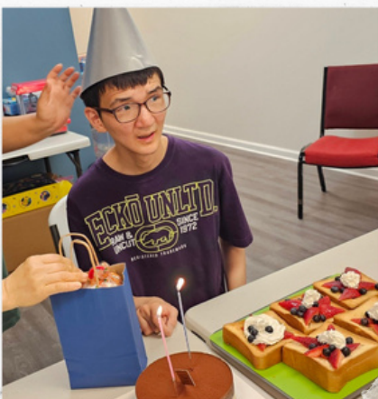
쏟아지는 관심이 부담스러운 재력이