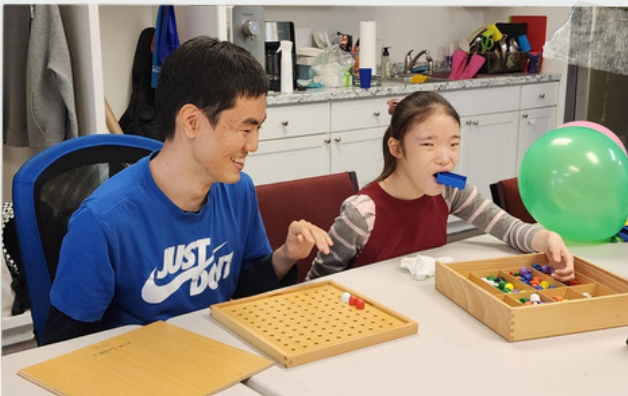
민용오빠님 기다려봐~* 내가 골라줄게