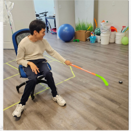
앉아서 하는 하키