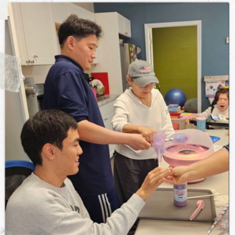
추억의 솜사탕 만들기 나래어머니가 더 좋으신 듯