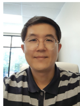
WRITTEN BY 장진원 목사님

요나가 그런 것처럼 우리도 역시 이해할 수 없는 하나님과 현실을 만나지만, 이 하나님이라는 분이 선택하시고 우리를 위하시는 분이라는 성경의 증언을 믿음으로, 폭풍 속에서도 하나님의 은혜와 자비를 발견하시는 원미니스트리 가족분들 되시기를 축원합니다.