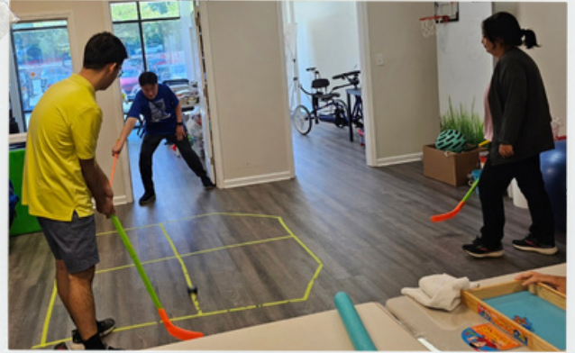
신나는 실내 하키 게임