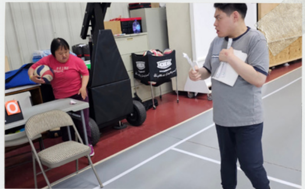
왜 거기서 나와?