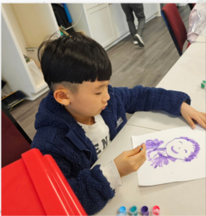
행복한 엄마 얼굴