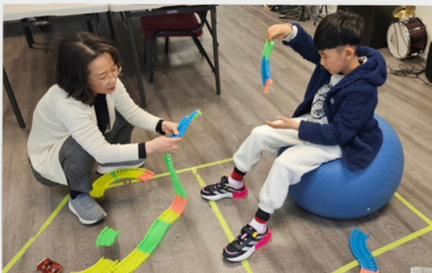
구선생님이 더 즐거운 함께 조각 맞추기