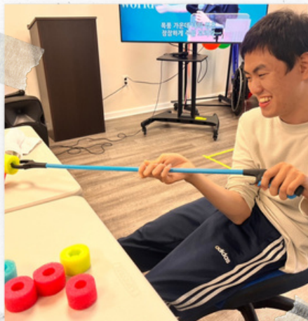
Grabber 로 재미와 재활을 동시에