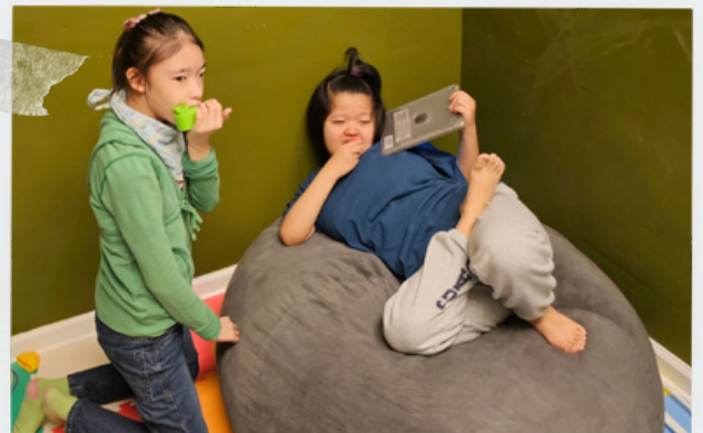
다들 재미있게 놀고 있구만