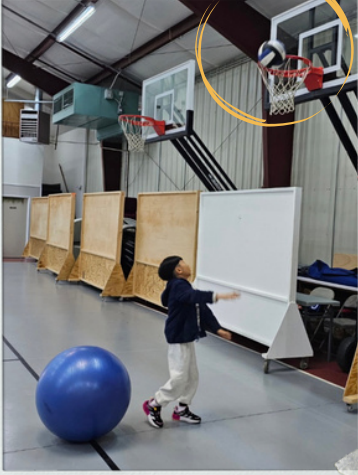
절묘한 순간 포착