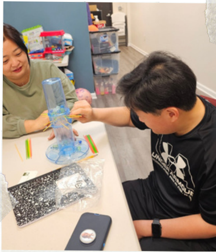
흥미로운 activity가 넘치는 센터