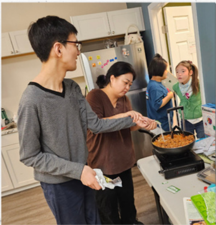
맛있는 음식을 위한 마지막 터치