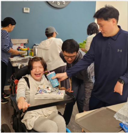
누나님 먹어봐요~* 마냥 좋은 누나