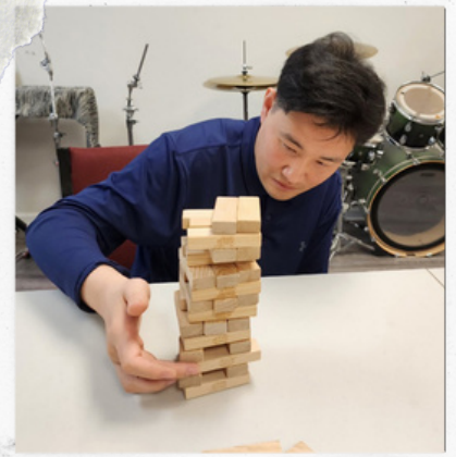
호흡을 멈추고 Jenga Game