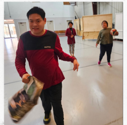
공놀이 하기 싫어 바람처럼 도망가는..