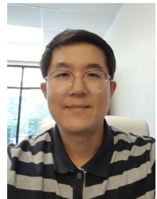
WRITTEN BY 장진원 목사님