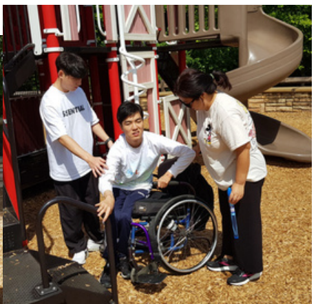
놀이터에서도 즐거워 할때!