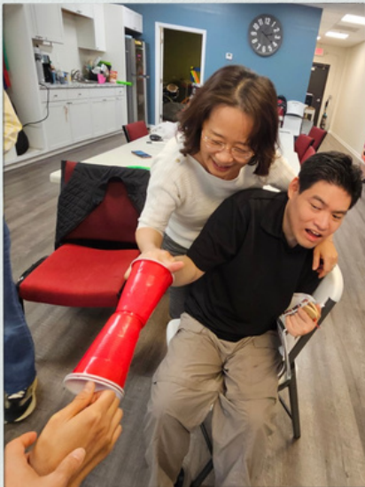
주먹 넣고 전달하기