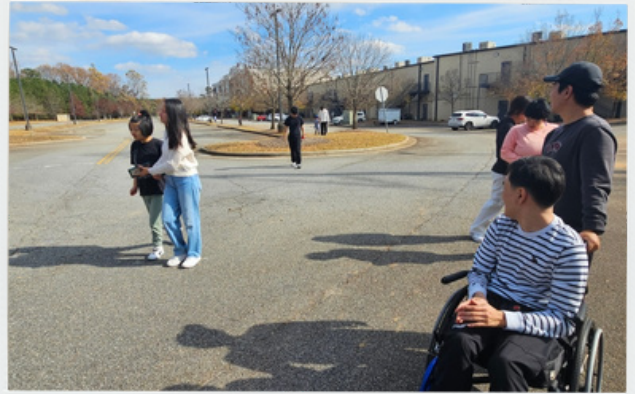
좋은 날씨속에 산책