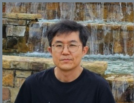
WRITTEN BY 장진원 목사님

새해에는 하나님을 알고자 하는 강한 열망으로, 의에 주리고 목마른 자가 되어 소망 가운데 사시는 원미니스트리 가족들 되시기를 축원합니다.