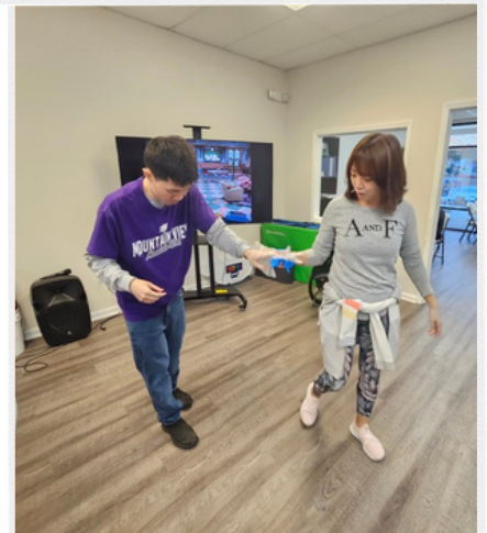
빨리 걷기 연습