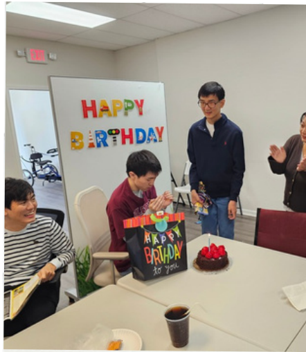
순진이 생일 축하