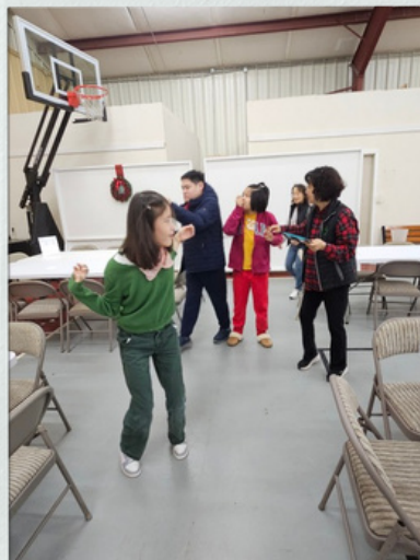
오늘도 열심히 걷기