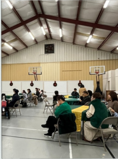
송년 가족의 밤