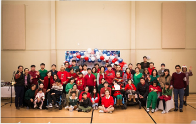
SSEM 크리스마스 파티