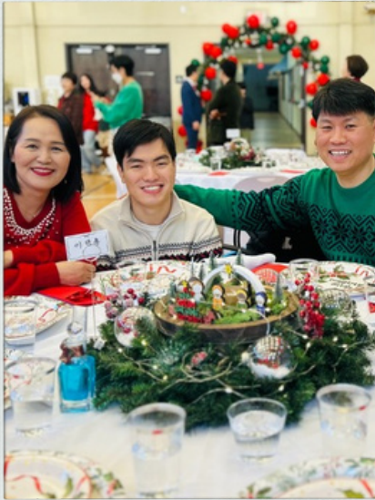
SSEM 크리스마스 파티