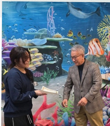
봉사자 수료증 전달