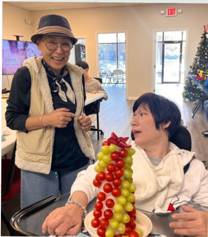
과일 성탄트리 만들기