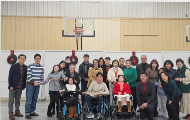
송년 가족의 밤