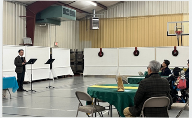
송년 가족의 밤